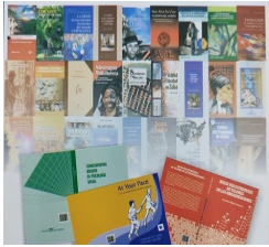
Encuadernación de Libros, Tesis, Folletos..etc