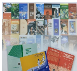
Encuadernación de Libros, Tesis, Folletos..etc