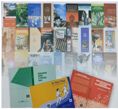
Encuadernación de Libros, Tesis, Folletos..etc